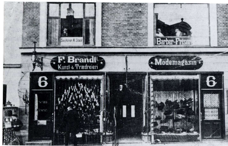
Sådan så der ud i Skomagergade nr. 6 omkring 1910. Drejerforretning til den ene side - modebutik til den anden.