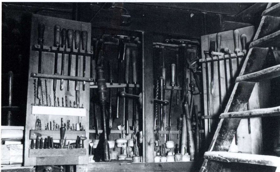
Det gamle værksted i bagbygningen til Skomagergade 6 er stadig propfyldt med drejerværktøj.

kom med eller sendte til os. Som oftest i form af smådele eller bare brudstykker. Det var spændende at have med at gøre og det samme gjaldt det minutiøse arbejde med reparation af smykker. Også det lavede vi meget af i mange år.