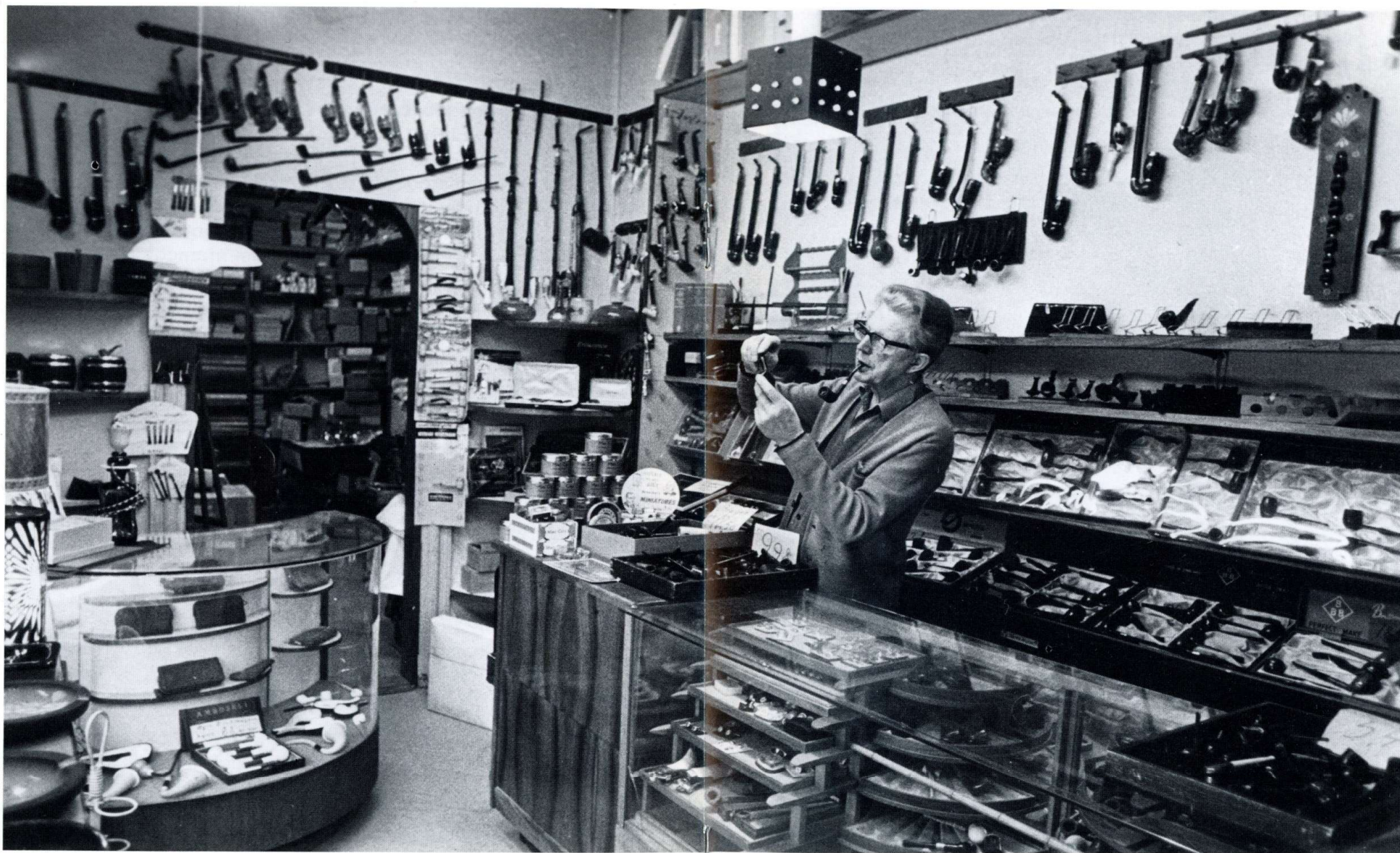
Inde i forretningen hos "Pibe-Brandt" engang i 1970'erne.